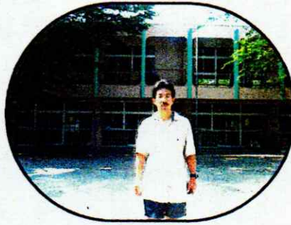
園舎とツーショット